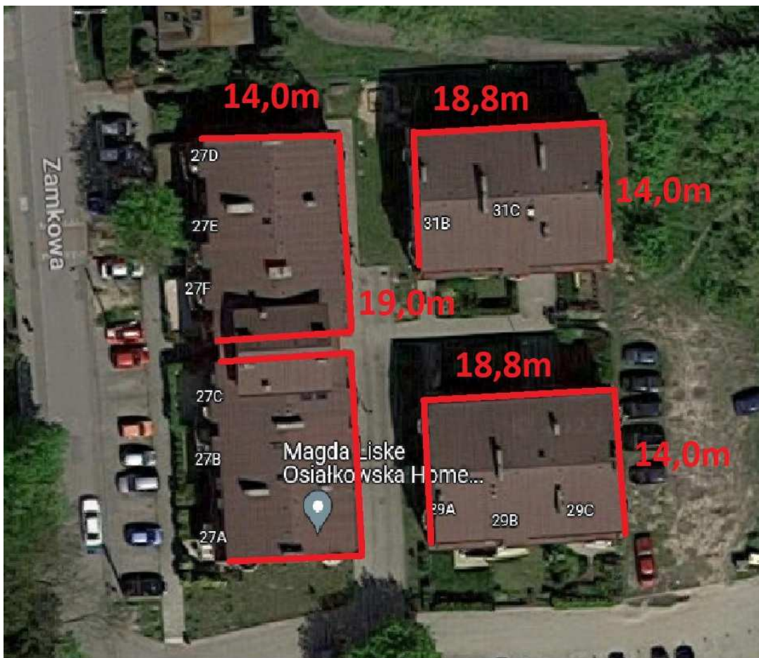
Zejście do pomieszczenia węzła Zamkowa 27_